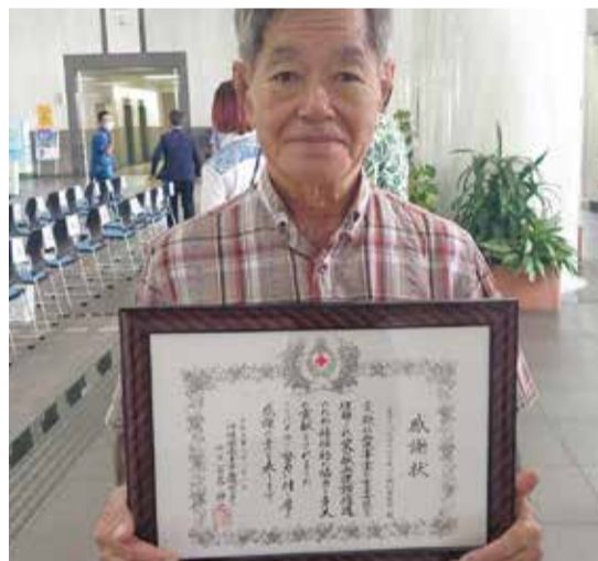
表彰式には大田安心安全部会長が出席しました。

よぎトックリキワタまつりでは、3年連続で献血ブースを開催し広く献血協力を呼びかけてきました。この活動が認められて、血液センターよりまつり実行委員会に感謝状が贈られました。表彰式は8月21日沖縄県庁1階のロビーで執り行われました。