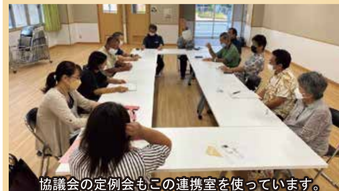
協議会の定例会もこの連携室を使っています。