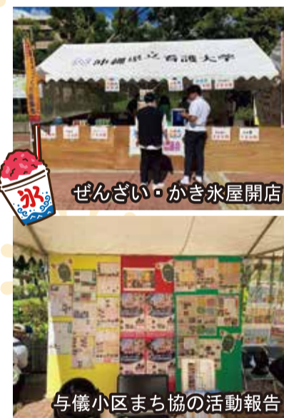
与儀小区まち協の活動報告

第43回城岳地域盆踊りの夕べ 新型コロナウイルス感染症が「5類」に引き下げられたことにより、3年ぶりの2023年8月19日（土曜日）に城岳盆踊りの夕べが（城岳小学校近く）中央公園で開催されました。「城岳地域盆踊りの夕べ」は、地域住民の交流場として地域に根づき今年で43回をむかえます。舞台ではダンスや踊りなど色々な舞台上で盛り上がり、出店も多数出店して大盛況でした。地域の人々の笑顔が印象的でした。