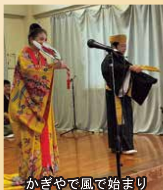
かぎやで風で始まり