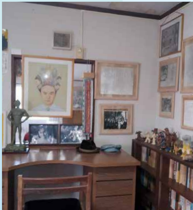
▲南風原町津嘉山の松風苑内金城哲夫資料館