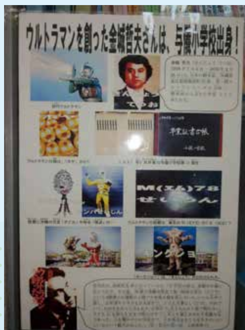
▲与儀小学校にあった資料