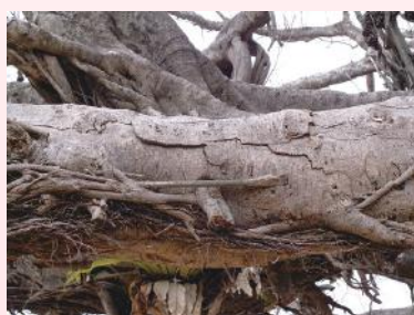
厚い樹皮がポトポト落ちて危険な状態