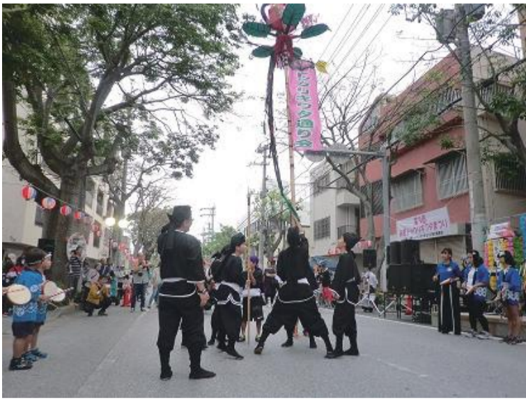
写真：与儀っ子の元気な旗頭で始まった第3回トックリキワタまつり

例年どおりだと11月には大きな地域祭りである真和志まつりと与儀つ子まつりの二つが重なっており、今回「繰上げ」する事により、2つの祭りが重ならない様にするというねらいがあります。あわせて同会では、好評の歩行者天国は今年も決行することが確認されました。