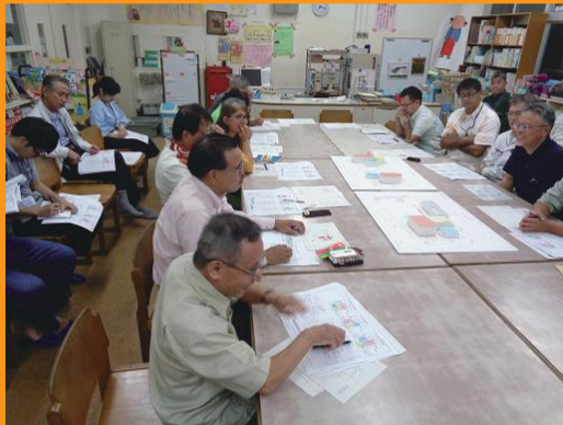
模型を使つての説明と意見交換

八月二十九日に与儀小図書館で、市教育委員会による与儀小校舎建替えの説明会が開催されました。今回対象になるのは、特別校舎を含む校舎の南半分、体育館、それと給食棟。3つの案が提示され、活発な意見交換がなされました。市教委は、令和五年度の完成をめざし、今後も同会を適時開催していく方針を表明し会を閉めました。