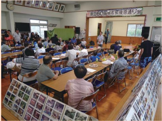
岸本会長による開会のあいさつ