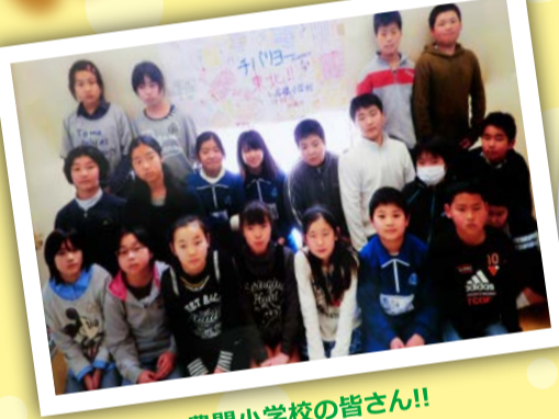
豊間小学校の皆さん!!