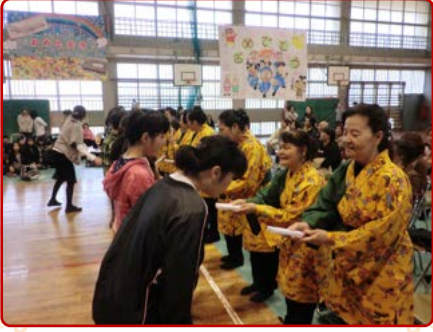
サークルの皆さんから 生徒へ学用品を贈呈

与儀小学校区まちづくり協議会では、今後もいろいろな方々と交流をもち「おせっかいな街」にむけて取り組んでいきたいと思っています。