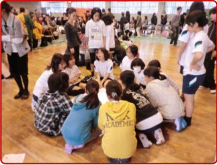
いわき市立豊間小学校へ 寄せ書き中